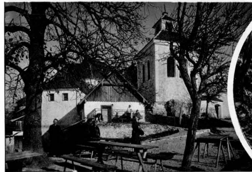
Zvonik in duhovniško stanovanje (na levi) z gostilniške terase vrhu Šmarne gore. — Na levi: kapelica sv. Antona tik pod vrhom Šmarne gore.