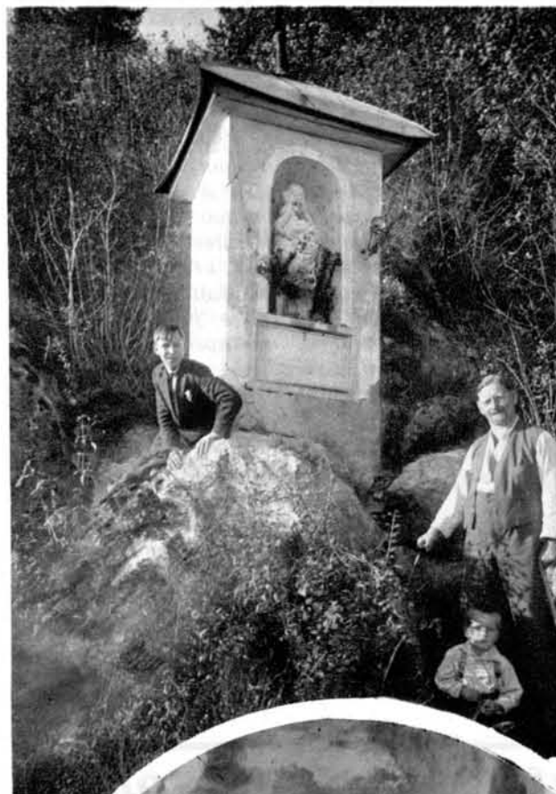
Kapelica »velika sobota« tik pod sedlom med obema vrhovoma; kapelica je zgodovinskega pomena in še dandanes nese vsak, ki gre prvič na Šmarno goro, s seboj lesen križček, ki ga tu odloži.