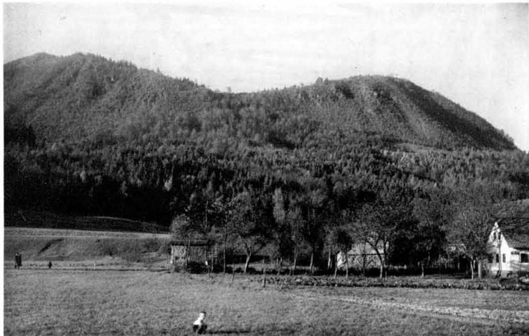
Pogled na Šmarno goro (na desni) in Grmado (na levi) iz Tacna.